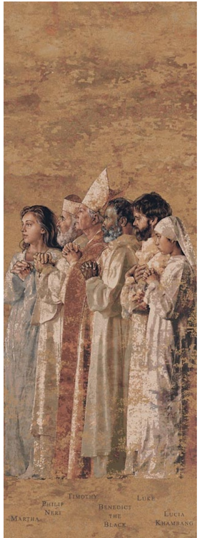
Communion des Saints, John Nava, Cathédrale Notre-Dame des Anges, Los Angeles (USA) XX ème