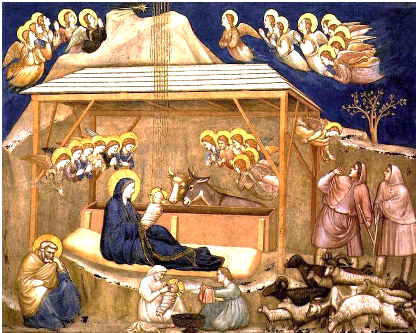
Il s'agit d'une Fresque se trouvant à l'Eglise inférieure saint François d'Assise à Assise, transept Nord, 1310.

Premier grand génie de l'art pictural italien à l'aube de la Renaissance, Giotto, peintre et architecte florentin, marque la rupture définitive de la peinture avec la longue tradition byzantine qui depuis la fin du monde romain imprégnait fortement l'art de la péninsule.